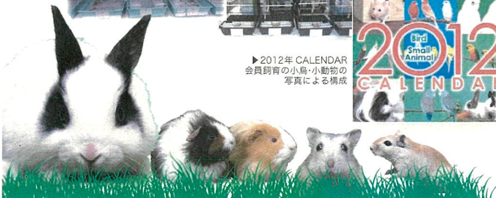
▶2012年 CALENDAR 会員飼育の小鳥・小動物の 写真による構成